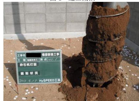
写真1 土質確認状況